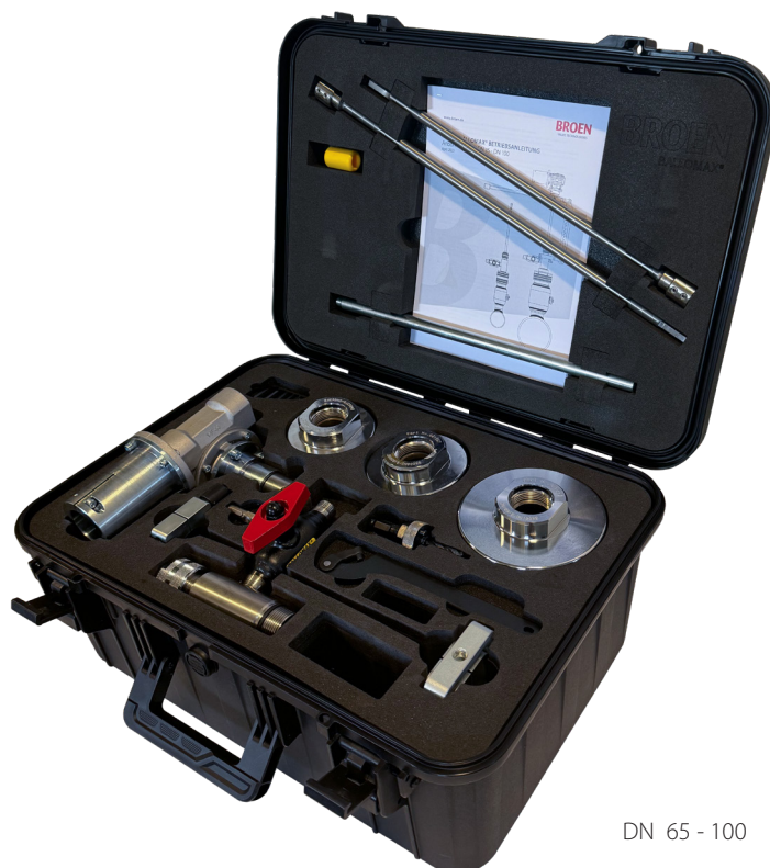
DN 65 - 100

Til de nye, optimerede BALLOMAX®-anboringventiler DN 65 til DN 100 fuld boring vil der senere kunne fås et opdateret suppleringsæt. Dette værktøjs-/suppleringsæt vil kunne anvendes med BALLOMAX®-anboringventiler fra DN 65 til DN 100 reduceret og fuld boring.