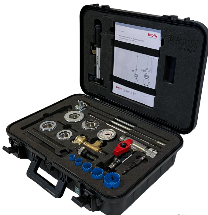
DN 15 - 50

Basissæt 68 501 015 000 og suppleringsæt 68 503 065 000 kan anvendes sammen med de tidligere leverede samt med de nye, optimerede BALLOMAX®-anboringventiler med reduceret boring.